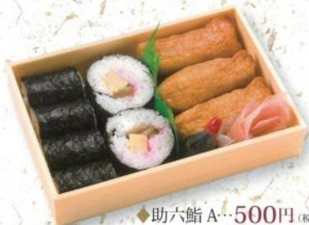
◆助六鮓 A…500円 (税込 540円)