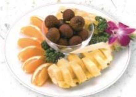
◆フルーツ盛り合わせ 2,200円 (税込 2,376円)