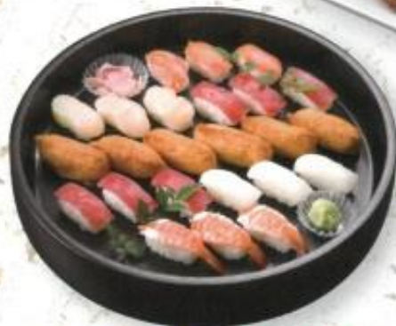
◆握り寿司 B 3,600円 ※3人前 (税込 3,888円)