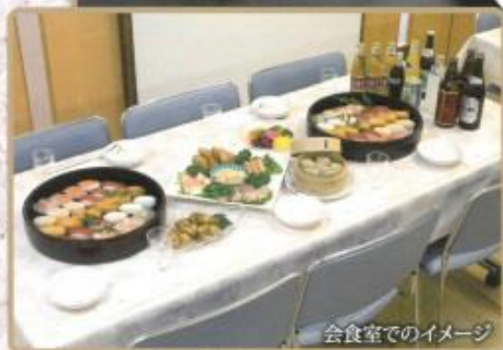
会食室でのイメージ