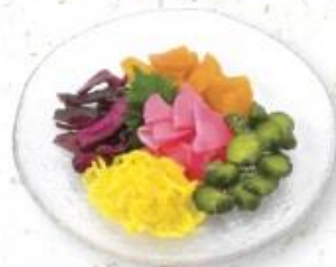
◆香の物 500円 (税込 540円) ※3人前