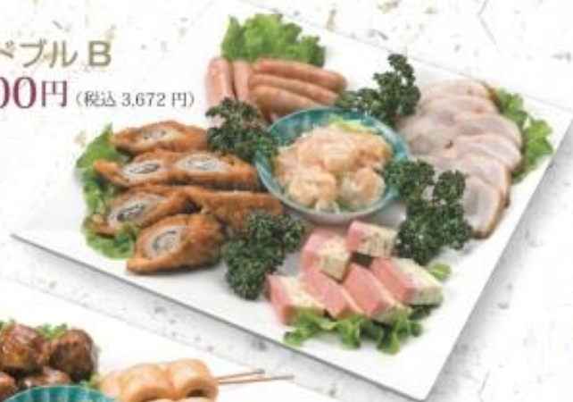
◆オードブル B 3,400円 (税込 3,672円)