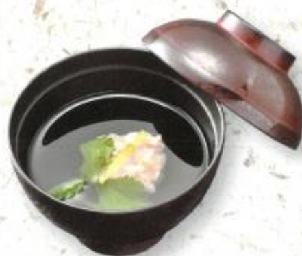
◆吸い物…300円 (税込 324円)