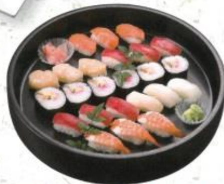
◆握り寿司 C 3,800円 ※3人前 (税込 4,104円)