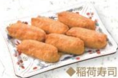
◆稲荷寿司 800円 (税込 864円)