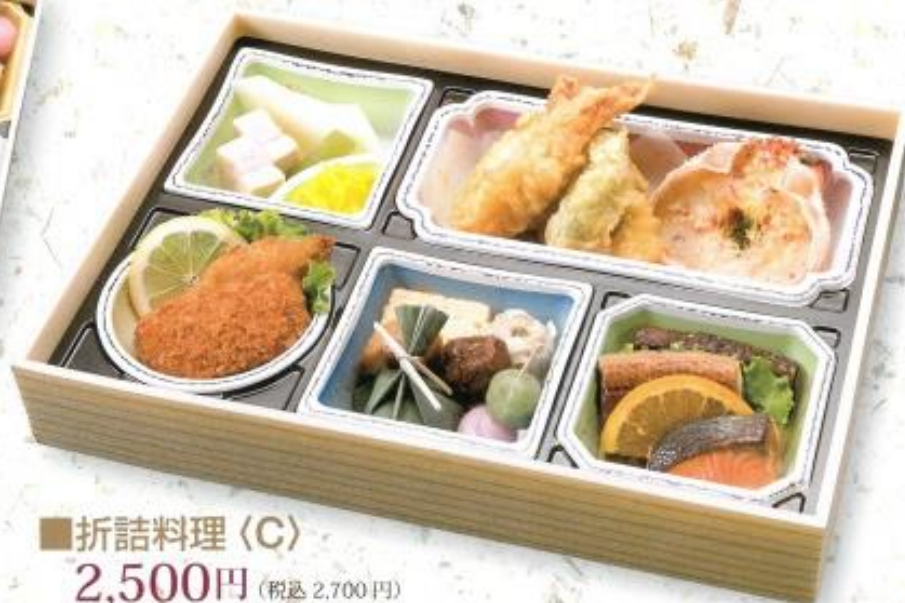
■折詰料理〈C〉 2,500円 (税込 2,700円) 箱サイズ: 縦 24.5cm × 横 34cm