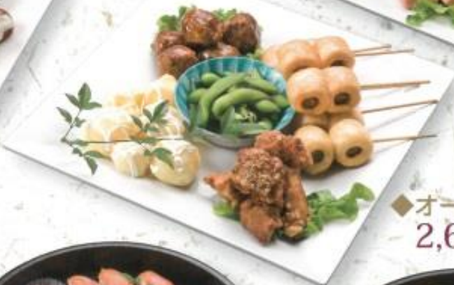
◆オードブル A 2,600円 (税込 2,808円)