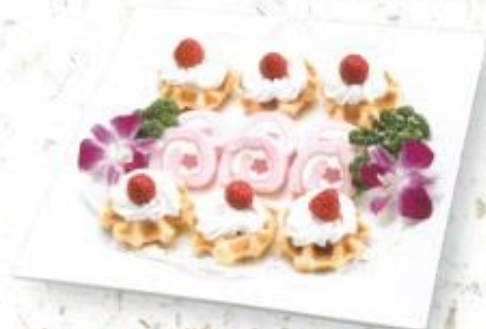
◆ケーキ盛り合わせ 1,500円 (税込 1,620円)