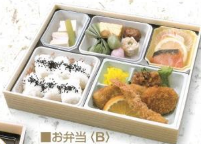
■お弁当〈B〉 2,400円 (税込 2,592円) 箱サイズ: 縦 23cm × 横 29cm