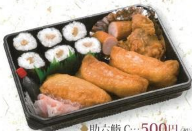
◆助六鮓 C…500円 (税込 540円)