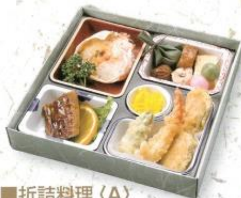
■折詰料理〈A〉 2,000円 (税込 2,160円) 箱サイズ: 縦 24cm × 横 24cm