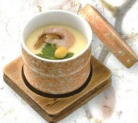
◆茶碗蒸し…350円 (税込 378円)