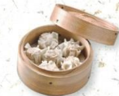
◆焼売 550円 (税込 594円)