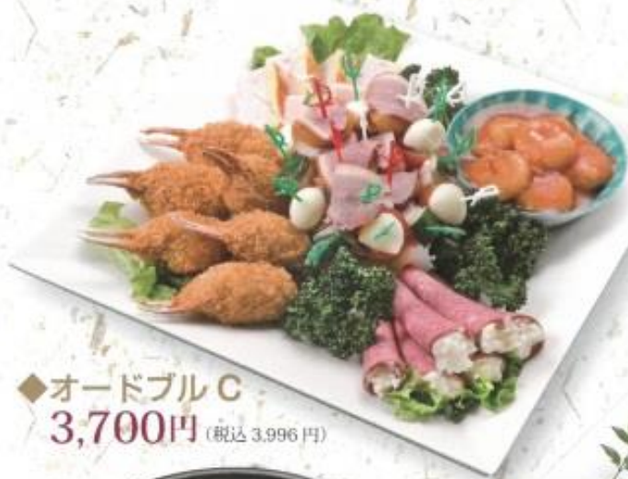
◆オードブル C 3,700円 (税込 3,996円)