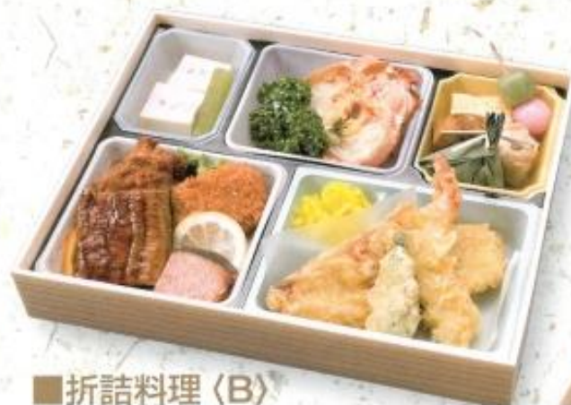
■折詰料理〈B〉 2,300円 (税込 2,484円) 箱サイズ: 縦 23cm × 横 29cm