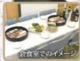
会食室でのイメージ