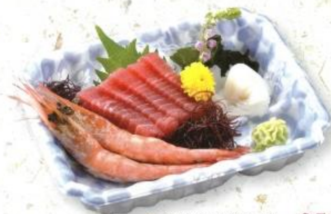
◆刺身盛り合わせ…650円 (税込 702円)