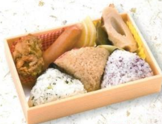
◆おにぎり弁当…500円 (税込 540円)