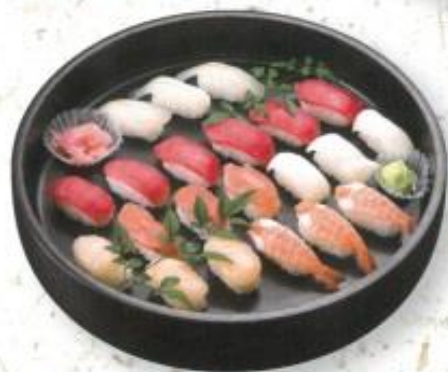
◆握り寿司 A 3,400円 ※3人前 (税込 3,672円)