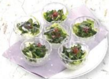
◆海藻サラダ 1,300円 (税込 1,404円)