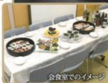
会食室でのイメージ