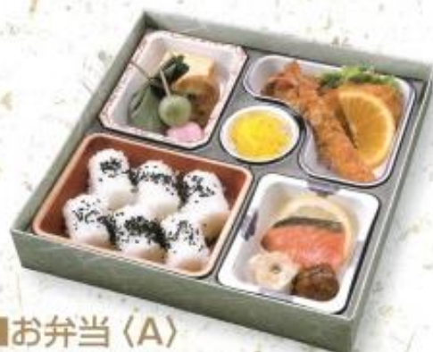
■お弁当〈A〉 2,100円 (税込 2,268円) 箱サイズ: 縦 24cm × 横 24cm