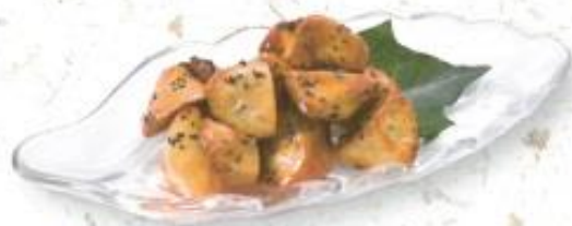
◆大学芋 700円 (税込 756円) ※3人前