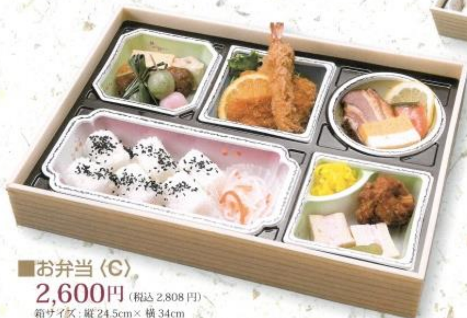
■お弁当〈C〉 2,600円 (税込 2,808円) 箱サイズ: 縦 24.5cm × 横 34cm